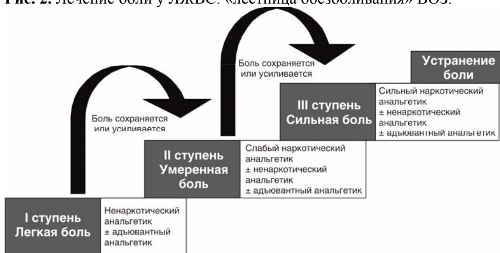
Рис. 2. Лечение боли у ЛЖВС: «лестница обезболивания» ВОЗ.